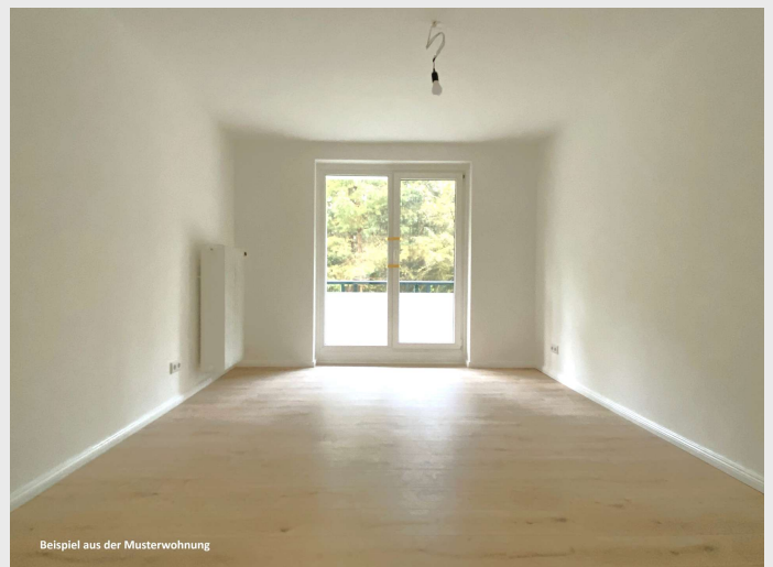
Beispiel aus der Musterwohnung