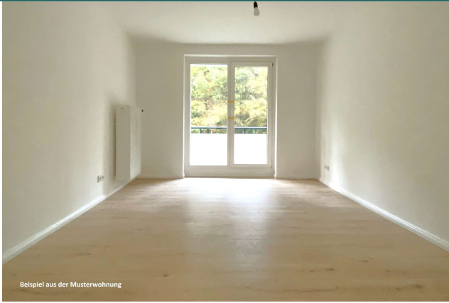
Beispiel aus der Musterwohnung